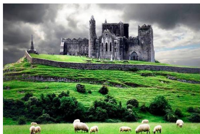
Mont Saint Michel, Francúzsko