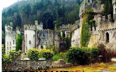
Castell Gwynedd, Abergelle, Wales - najkrajšie hrady a zámky z celého sveta