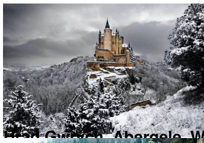
Castell Gwynedd, Abergelle, Wales